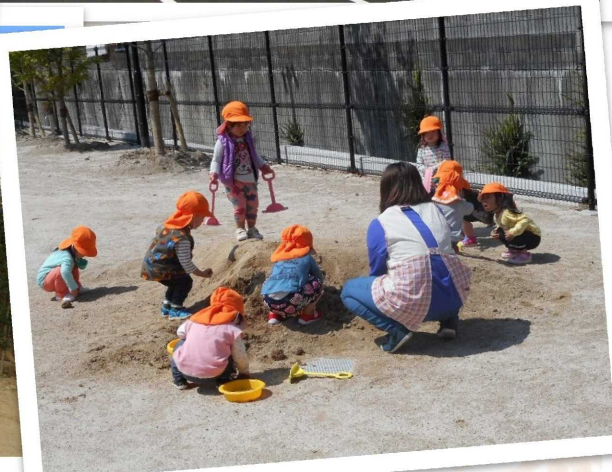
糟屋郡粕屋町 星の子保育園にて