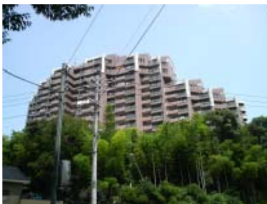
外 観 全 景

工事場所：北九州市小倉南区徳力 工 期：平成20年8月～平成20年12月 構造規模：SRC造 12階建 115戸 延床面積：11,337㎡ 用 途：共同住宅 設計監理：株式会社 甲山建築設計事務所