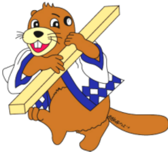
匠建設イメージキャラクター たっくん