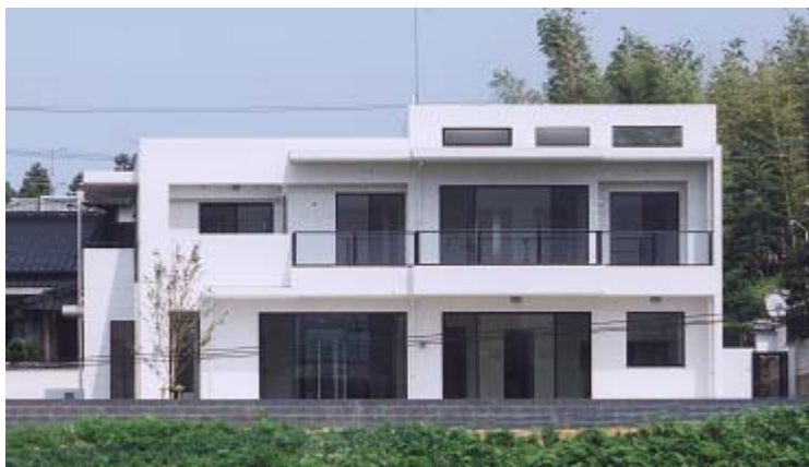
外 観 全 景