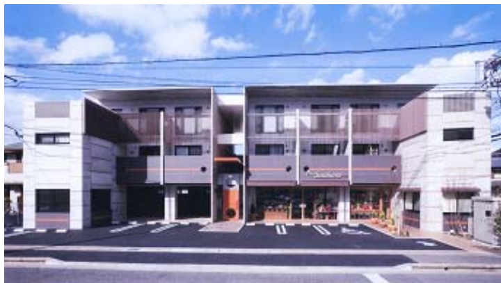
外 観 全 景