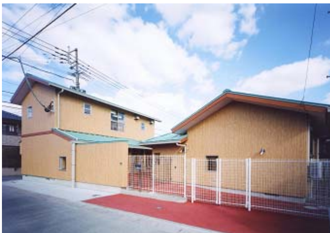
外 観 全 景